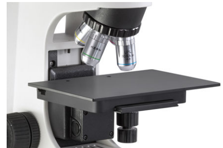
Platina y objetivos