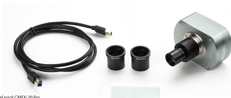
● Contenuto del pack CMEX-20 Pro